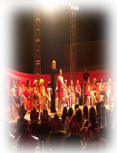
Cena Espectáculo "Solo Para Ellas" Palma de Mallorca